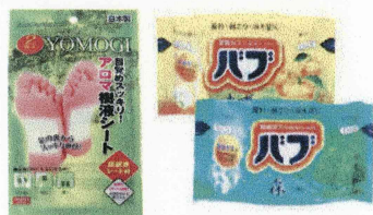
(上記のセットです)